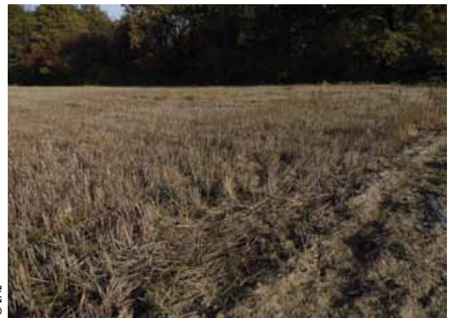
Zone d'hivernage d'un des pélobates brun suivi

On comprend bien alors l'importance de connaître et de préserver ces milieux pour assurer la survie des individus et, plus globalement, la pérennité de la population loirétaine. Cette étude sera reconduite dans les années à venir pour confirmer nos observations. Une cartographie globale des sols est également en projet sur le site afin de pouvoir mettre en évidence l'ensemble des zones d'hivernage potentielles de la population ●