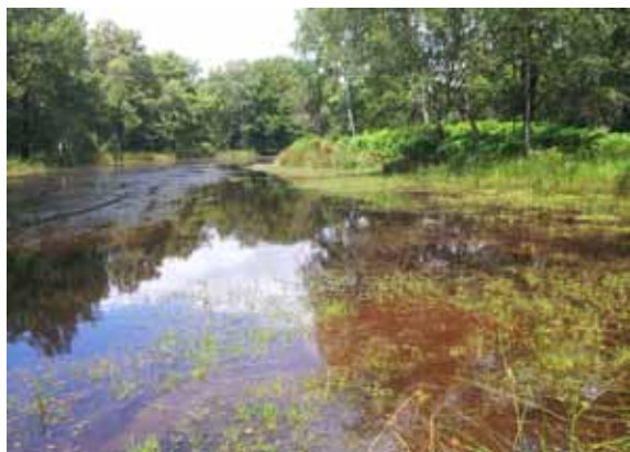
Mare de la ZNIEFF secteur humide de la transition terrasse-Sologne