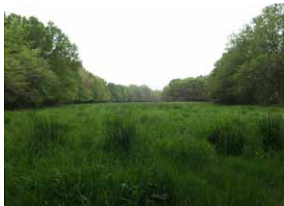
Prairie du Petit Vincennes