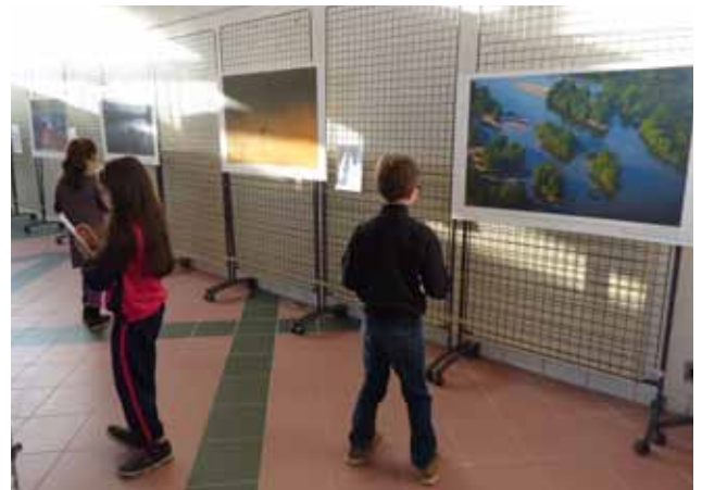
Exposition « La France sauvage » au salon Terre Naturelle à Orléans